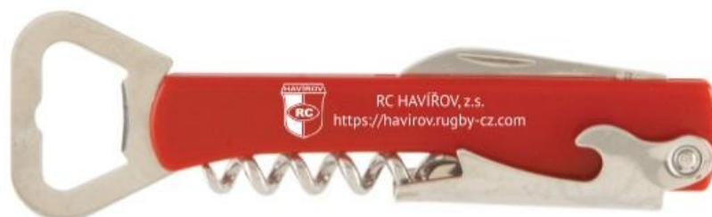
Univerzální otvírák 100 Kč