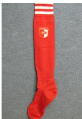
Klubové štulpny 125 Kč Antibakteriální úprava