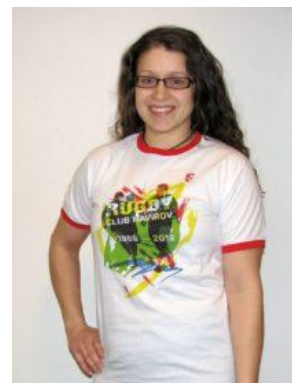
triko unisex 40 Kč