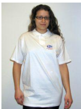
polokošile pánská/dámská 60 Kč Polokošile a triko k 50 letům klubu - výprodej