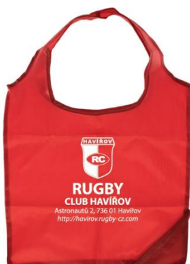
Nákupní taška 100 Kč